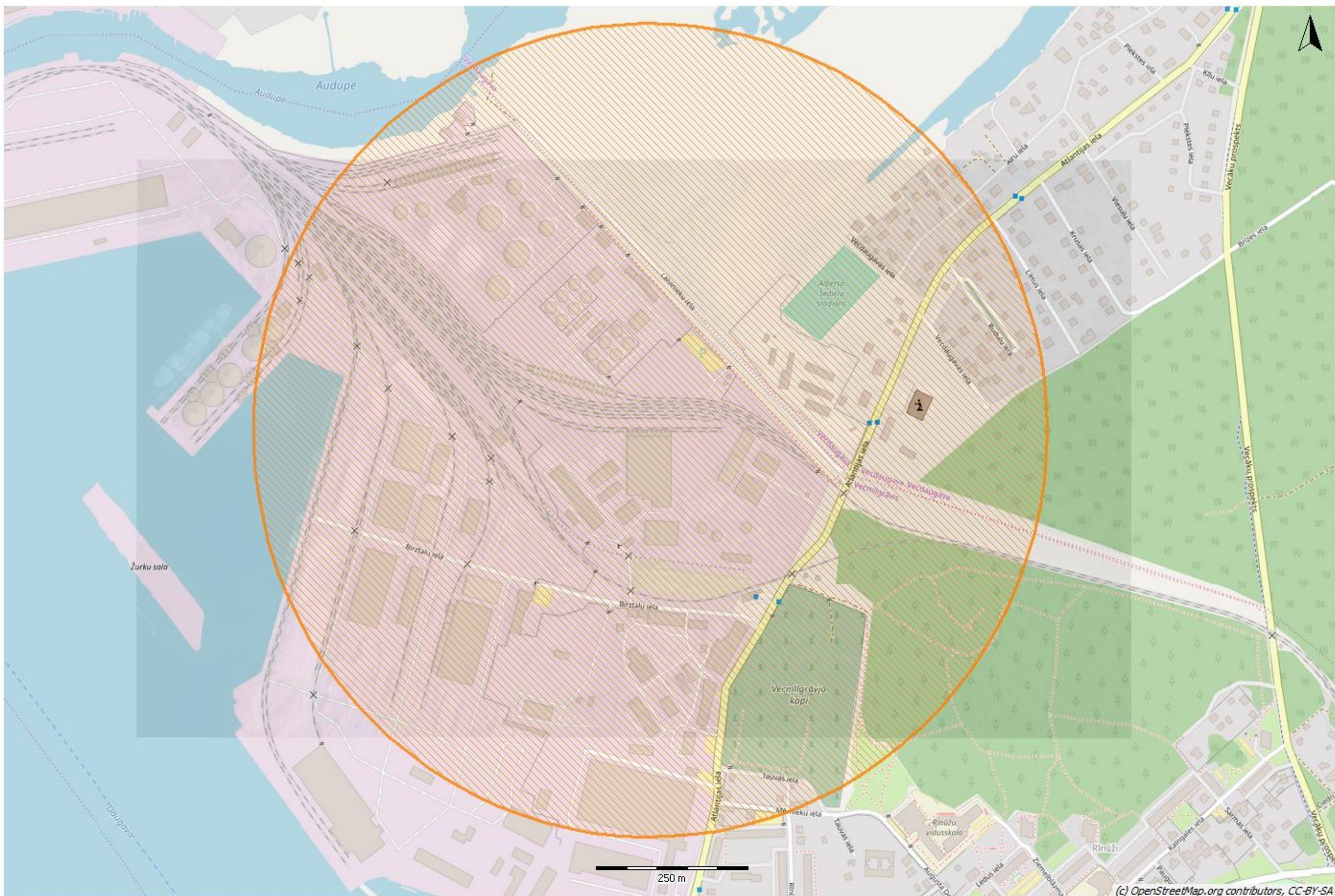
1.2. attēls. Maksimālās 1% letālās iedarbības distance ugunsgrēka gadījumā, kā rezultātā notiek nātrija nitrīta termiska sadalīšanās dzelzceļa vagonā