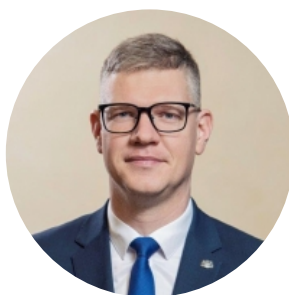
Vilnis Ķirsis Komitejas priekšsēdētājs