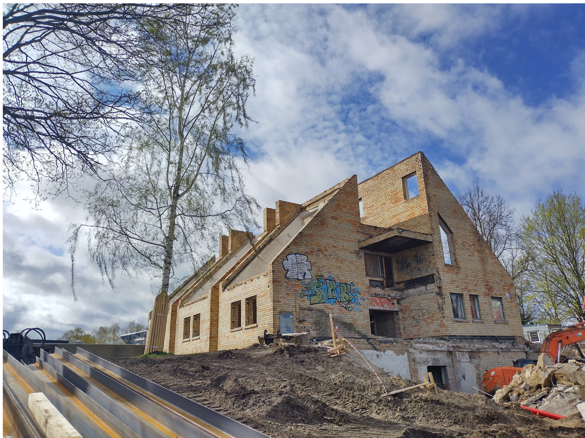
1. teritorijas fotofiksācija