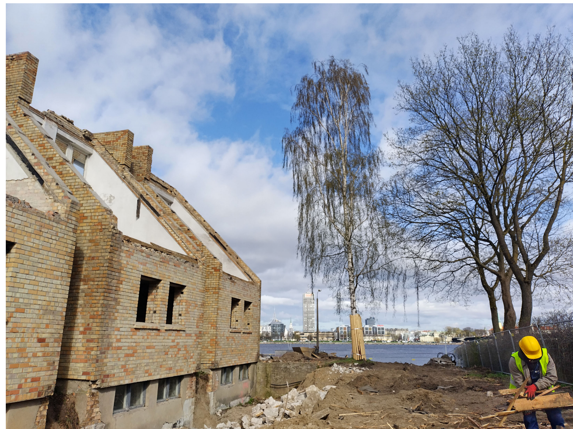
2. nocertamais koks - bērzs \varnothing 43 cm