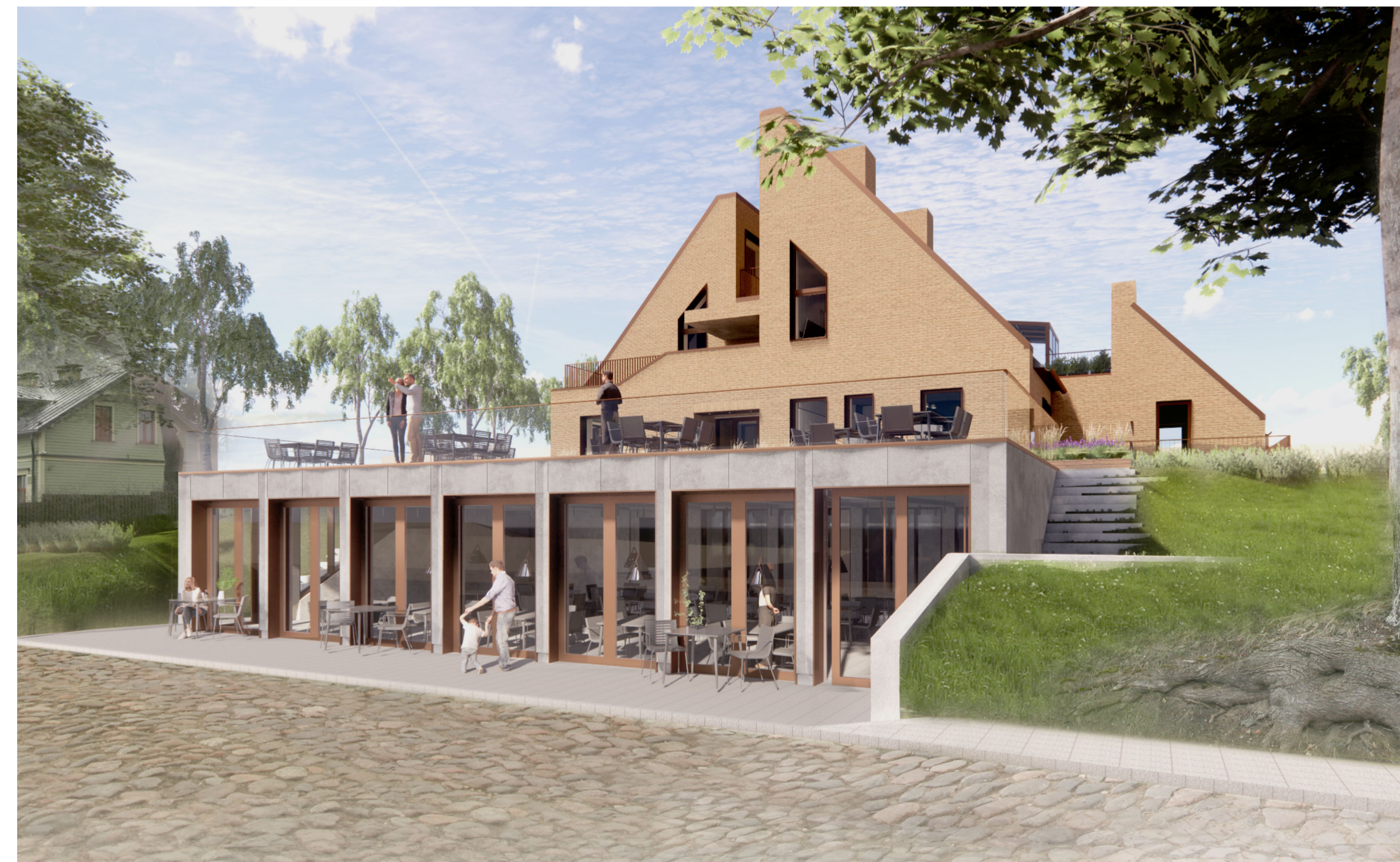
3. projekta vizualizācija